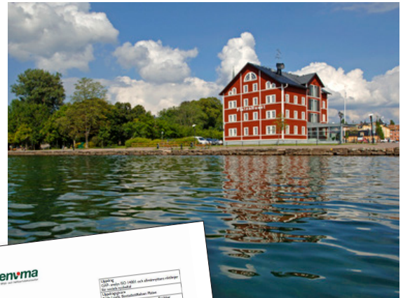
Bostadsstiftelsen Platens huvudkontor

Tel: 070-624 80 42 therez.borling@envima.se